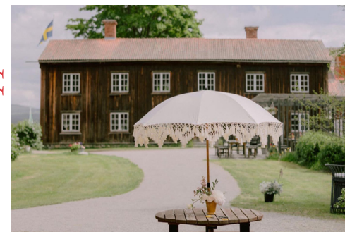
Träslottet. Dans på äng och lunchservering.