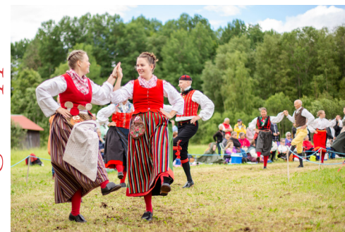
Hårga. Dans på slotteräng.