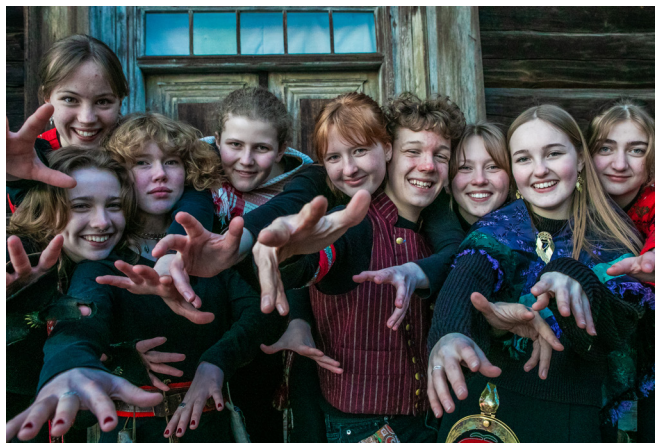
Ungdomsgruppen Schwung dansar i Järvsö.

För mer information: www.halsingehambon.com