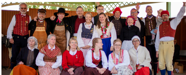
Vinnande laget 2022 - Tensta Folkdanslag.