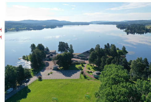
Långnäs. Dans på dansbana med möjlighet till bad.