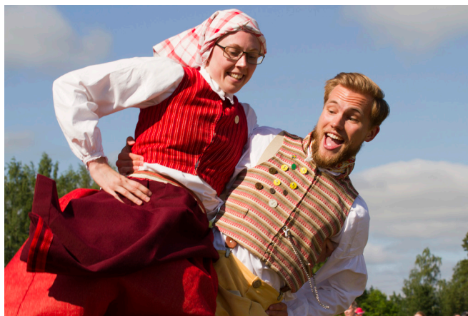
Under sista minuten får dansparen fria tyglar att charma publiken med egen kreativ stil för att öka chansen att vinna publikens pris!