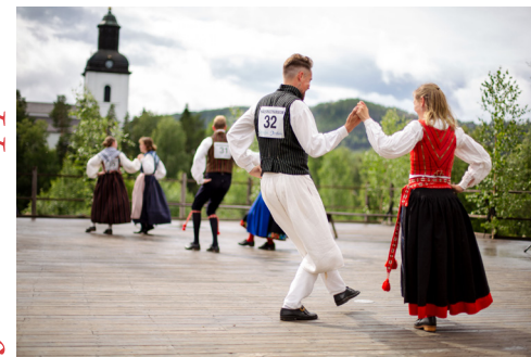
Stenegård. Dans på dansbanan vid stora scen.